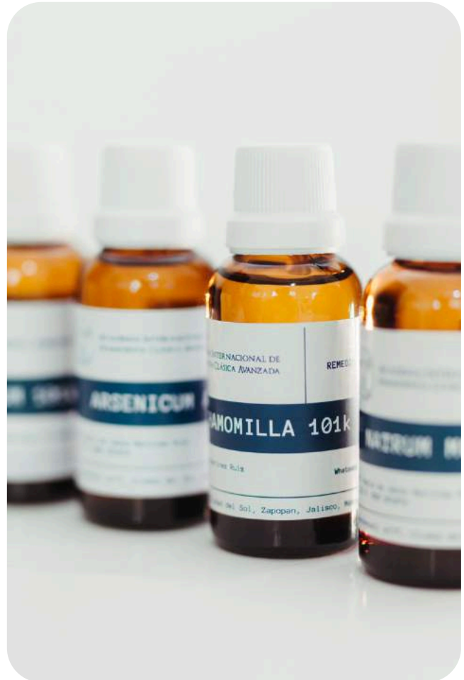
Remedios homeopáticos a la potencia 101k

Nunca antes se habían concebido potencias de remedios homeopáticos con vida propia en su fuerza medicamentosa, capaces de cubrir el espectro más amplio de aquello que alguna vez fue denominado como infinitesimal. Ahora, la potencia 101k encuentra su desarrollo práctico y tangible en la infinitesimalidad, adaptándose de forma flexible al número de las potencias más altas que se han producido hasta ahora.